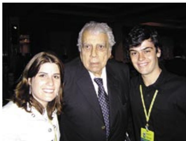
Alunos da Facens Jr. durante o Congresso.