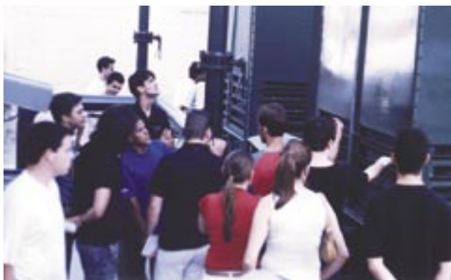
Alunos visitam sistema de ar-condicionado do Esplanada Shopping.

A próxima visita prática a ser realizada pela turma da FACENS é ao sistema de refrigeração e ao setor de vapores de uma cervejaria.