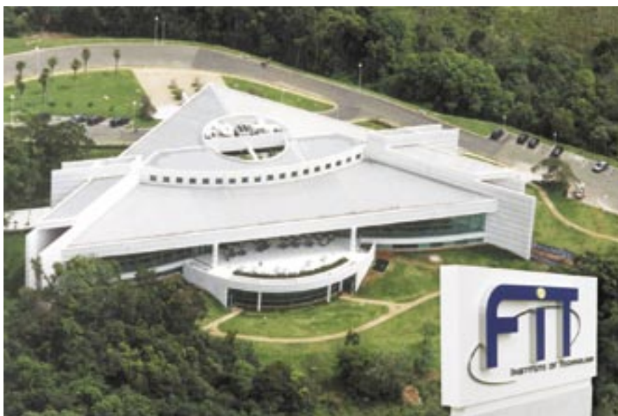
Flextronics Instituto de Tecnologia