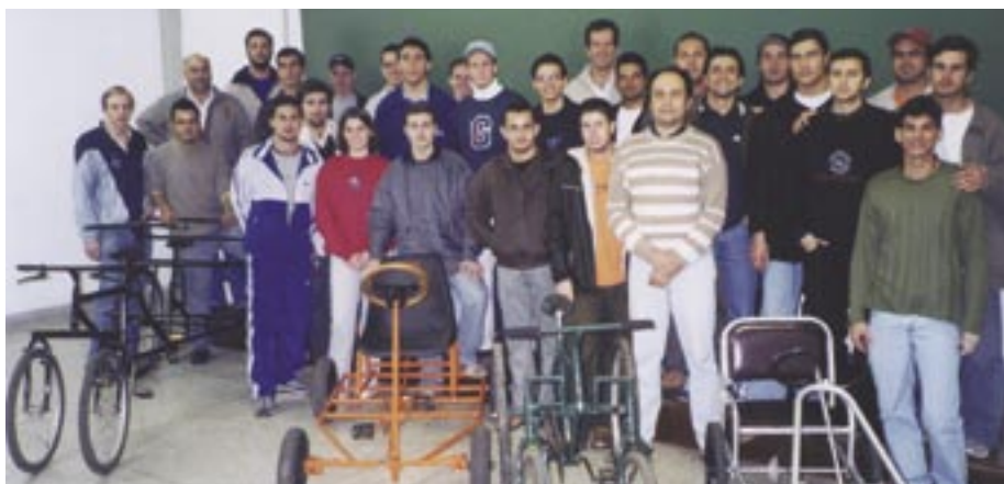
Alunos do 2º ano de Engenharia Elétrica e seus projetos.

Segundo ele, diante das barreiras, o improviso acabou sendo a ferramenta indispensável para o sucesso do projeto. “Fizemos um projeto simplificado, no papel, porém, quando partimos para a construção, não funcionou. Tivemos que improvisar e discutir qual a alternativa que teríamos para resolver o impasse”, falou. “O grupo concordou que, em virtude das dificuldades exigidas, nós atingimos o objetivo”, comemorou.