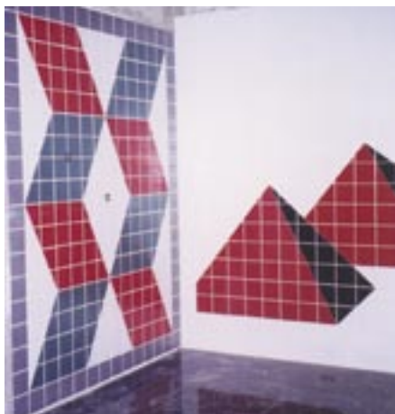
Trabalhos em cerâmica realizados por alunos do CTCC da FACENS.