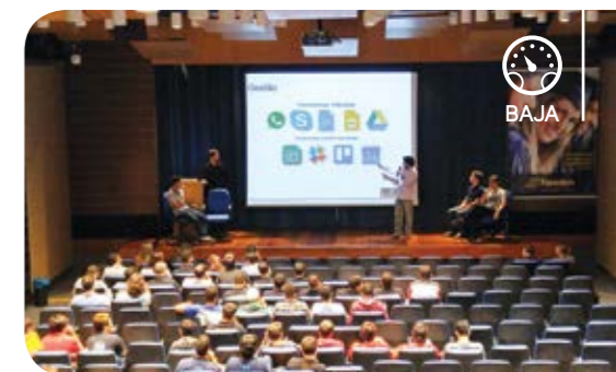
Baja Meeting uniu várias equipes na Newton, em BH

A Facens e o Centro Universitário Newton Paiva promoveram, em julho, a primeira edição do evento BH Baja Meeting, em Belo Horizonte. O encontro reuniu nove equipes interessadas em conhecer os projetos desenvolvidos pelos times Camaleão Baja SAE Newton Paiva e Facens Baja Mud Racing.