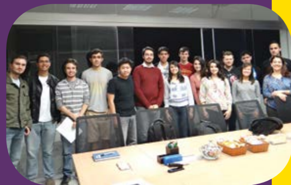
Alunos da Facens selecionados para o intercâmbio em Lleida