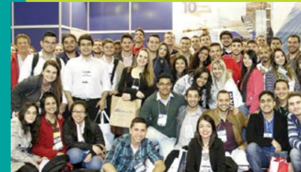
Alunos da Facens no Inter Solar