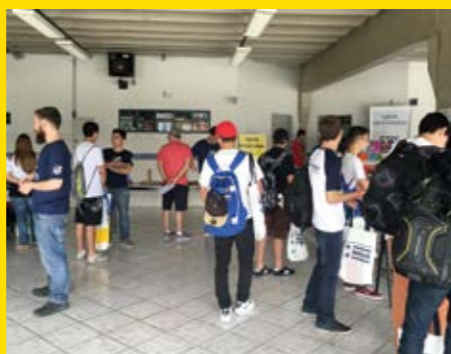
Facens compartilha experiências com os futuros universitários e instituições de ensino superior, despertando a curiosidade dos jovens para várias profissões

Neste evento gratuito o objetivo foi proporcionar, de forma participativa, o contato entre os futuros universitários e as instituições de ensino superior, despertando a curiosidade dos jovens para várias profissões. A Facens, que esteve ao lado de outras grandes instituições, como USP, Unifesp, ITA, FGV e Mauá, apresentou em palestras várias possibilidades de carreira na Engenharia, mostrando alguns dos seus principais projetos, como o carro Fórmula SAE, da Equipe V8 Racing, e o Fab Lab Facens. Além disso, tirou dúvidas dos estudantes interessados.