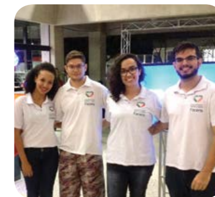
Equipe do Engenhando para o Bem aguarda novos interessados em participar do projeto

A equipe do Engenhando para o Bem promoveu uma importante campanha para engajar mais alunos em ações que beneficiam a comunidade. Em comemoração ao Dia do Voluntariado (28/08), frases inspiradoras sobre o tema foram espalhadas pelo campus . Também foram entregues panfletos com informações para quem deseja participar. Para se inscrever, entre em contato pelo e-mail engebem@facens.br