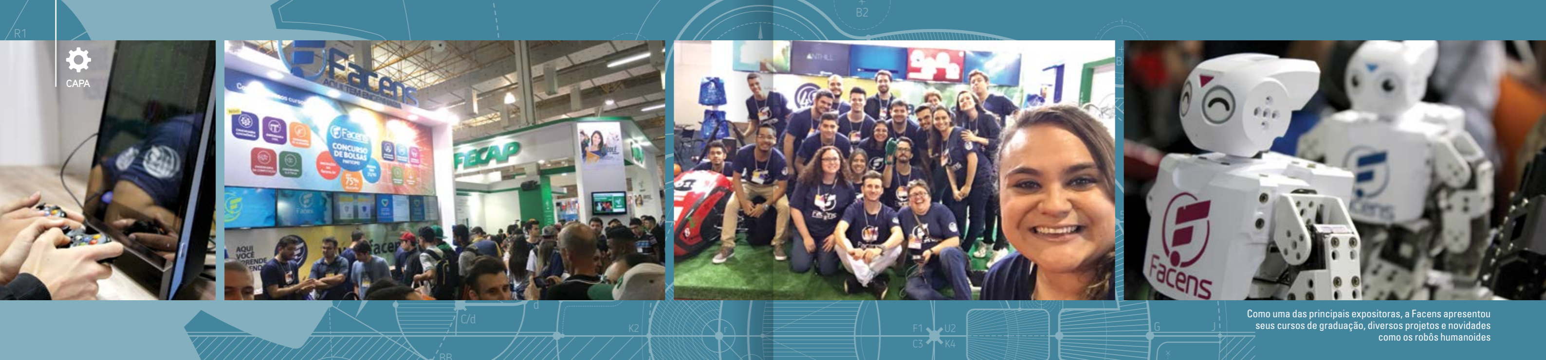
Como uma das principais expositoras, a Facens apresentou seus cursos de graduação, diversos projetos e novidades como os robôs humanoides