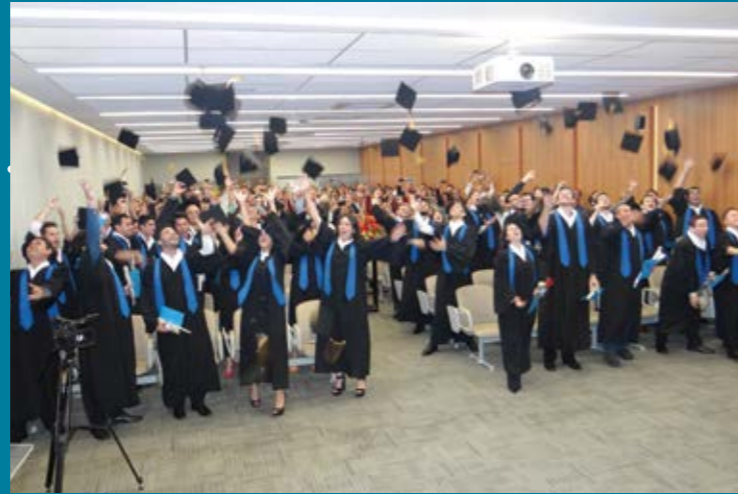
Recém-formados comemoram a graduação

Em agosto a Facens teve o orgulho de formar mais 51 novos engenheiros, das áreas de Engenharia Civil, Engenharia Elétrica, Engenharia da Computação, Engenharia Mecânica e Engenharia Mecatrônica.