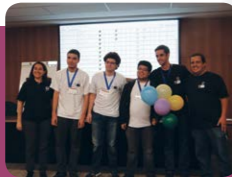
Alunos da Facens ficaram entre os mais bem classificados

Em 2015, cerca de 40 mil estudantes de Ensino Superior, de mais de 100 países, competiram em regionais em todo o planeta. Apenas 128 (cerca de 1%) participaram das Finais Mundiais, na Tailândia. •