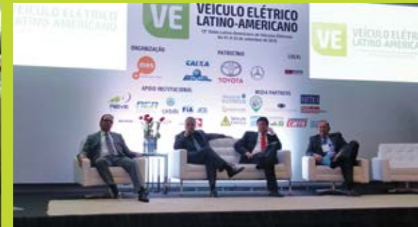
A equipe B'Energy (foto à esq.) se apresentou no evento que mostrou as novidades sobre veículos elétricos

À convite da diretoria da Associação Brasileira do Veículo Elétrico (ABVE), a Facens participou pela primeira vez do Salão Latino-Americano de Veículos Elétricos, em setembro.