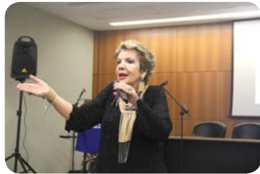
Leila Navarro foi a palestrante do evento

Leila Navarro, segundo a revista Veja , está entre os 20 mais notáveis palestrantes brasileiros. Segundo ela, “uma dica para saber se estamos no caminho certo é nos perguntar se nosso trabalho nos faz sentir valorizados, respeitados e se tem a ver com nosso sentido de vida. Se as respostas forem sim, isto dará força para continuar. Além disso, autoconhecimento e relacionar-se bem consigo mesmo é o primeiro passo para se comprometer com um objetivo e obter o resultado esperado”. •